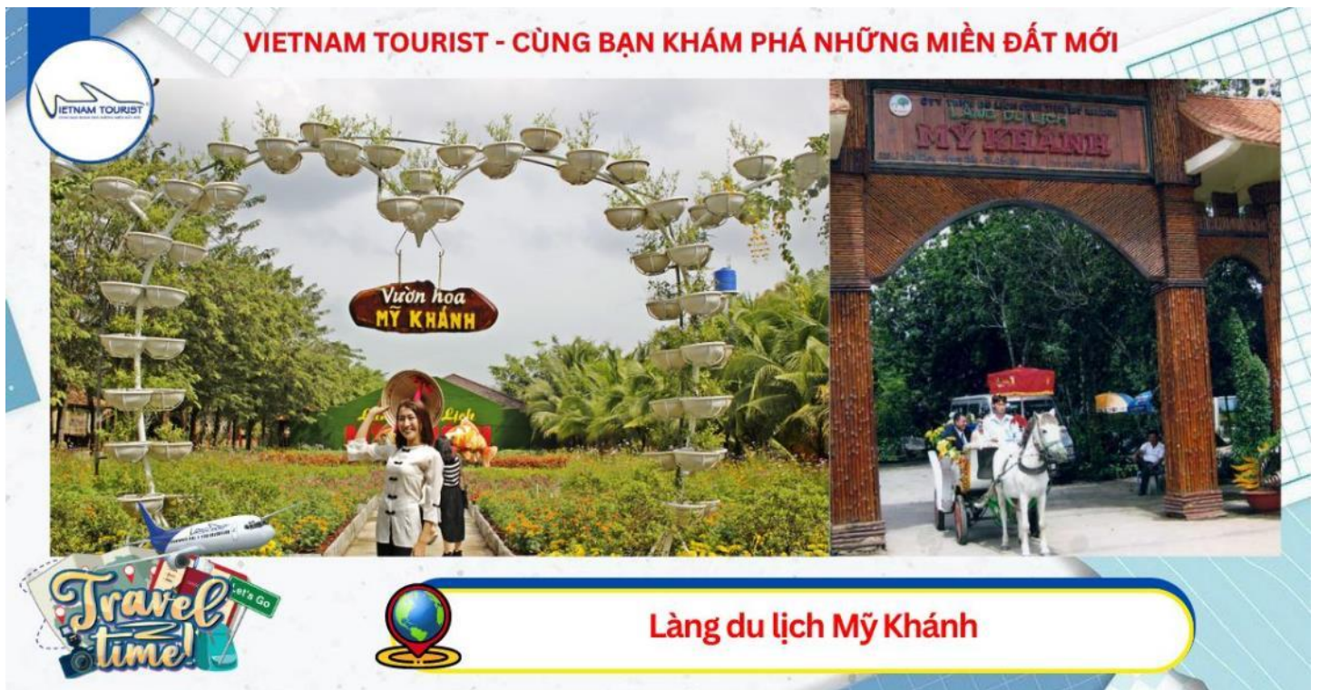
Làng du lịch Mỹ Khánh