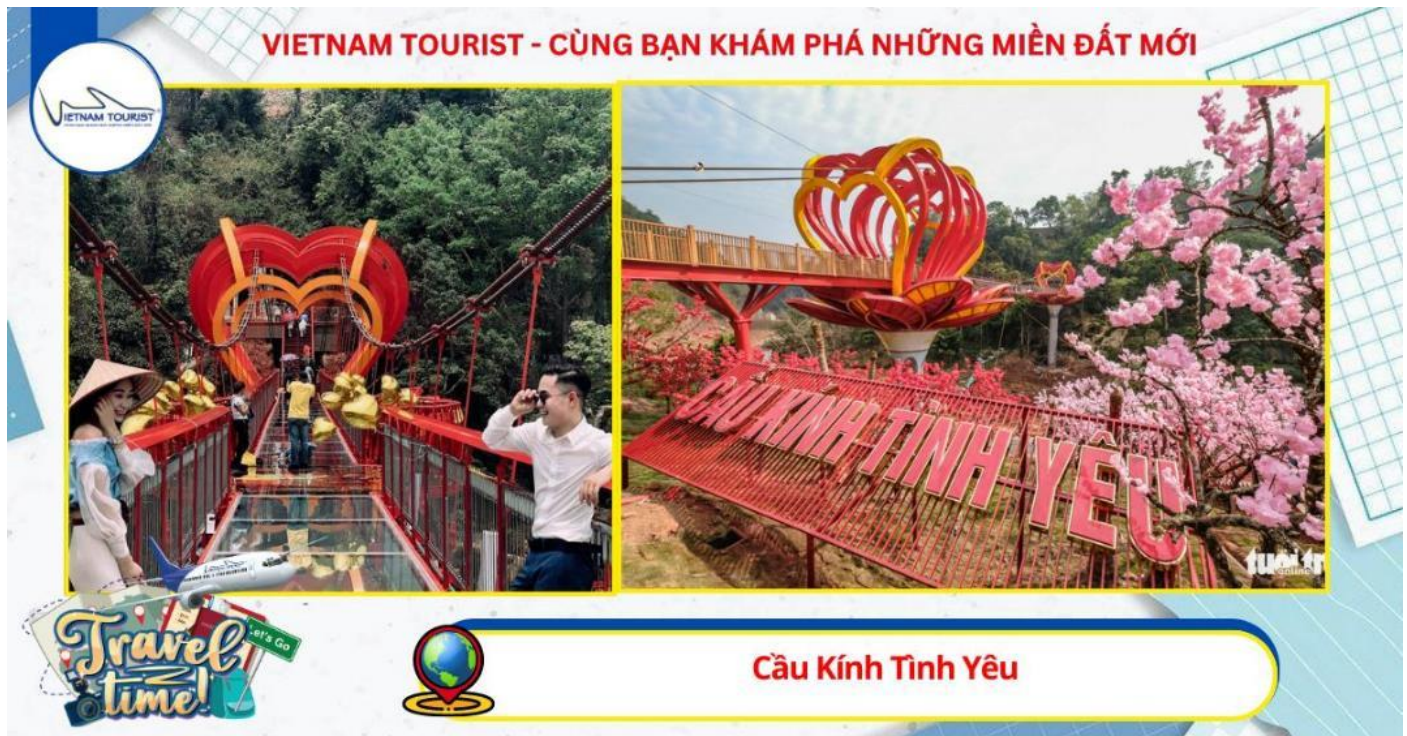
Cầu Kính Tình Yêu

hút vào ban đêm. Đứng trên cầu, bạn có thể chiêm ngưỡng toàn bộ khung cảnh Mộc Châu từ trên cao và nhìn thấu rừng núi bạt ngàn thông qua lớp kính dưới chân, đem lại cảm giác vừa hồi hộp vừa thích thú.