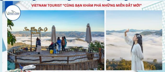
VIETNAM TOURIST "CÙNG BẠN KHÁM PHÁ NHỮNG MIỀN ĐẤT MỚI"

10h00: Quý khách ghé tham quan Nhà Ga Đà Lạt được biết đến là một trong những nhà ga cổ nhất Đông Dương còn tồn tại ở thời điểm hiện tại ở Việt Nam. Được khởi công xây dựng bởi người Pháp vào năm 1932. Đây là một trong những địa điểm check in đáng để tham quan khi ghé thăm Đà Lạt. Không chỉ nổi tiếng bởi lối kiến trúc độc đáo và đặc sắc, tại nơi này còn có nhiều góc chụp ảnh sống ảo cực đẹp.