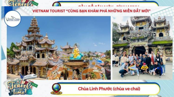
VIETNAM TOURIST "CÙNG BẠN KHÁM PHÁ NHỮNG MIỀN ĐẤT MỚI"