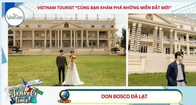
VIETNAM TOURIST "CÙNG BẠN KHÁM PHÁ NHỮNG MIỀN ĐẤT MỚI"