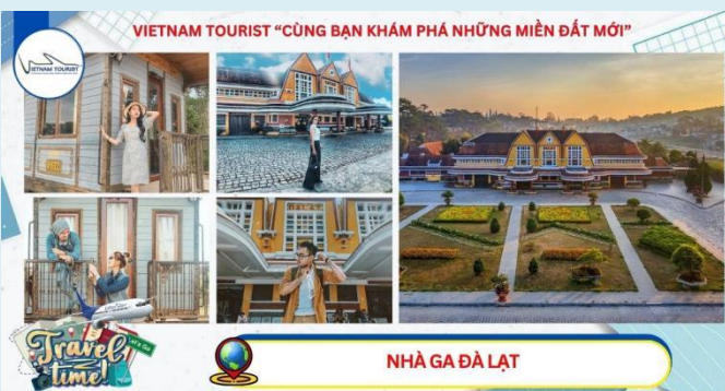
VIETNAM TOURIST "CÙNG BẠN KHÁM PHÁ NHỮNG MIỀN ĐẤT MỚI"