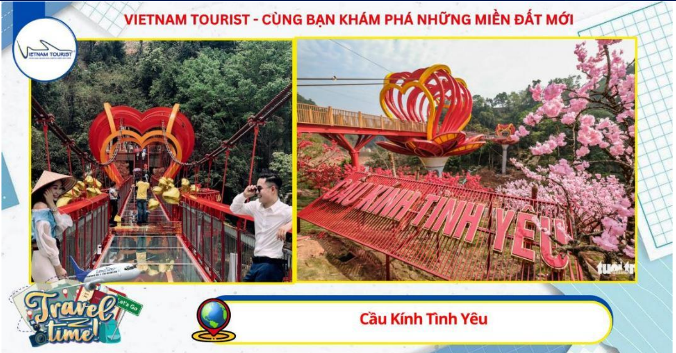
Cầu Kính Tình Yêu

09h30: Quý khách tập chung lên xe để đến với Khu du lịch Happy Land được mệnh danh là vườn hoa đẹp nhất Mộc Châu . Đến đây quý khách không chỉ sưa ngắm cảnh, hay thỏa sức chụp hình check in để có những bức ảnh đẹp lung linh khoe với bạn bè mà còn có những trải nghiệm vô cùng thú vị và hấp dẫn như: