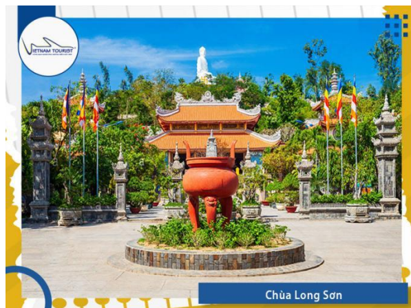
Chùa Long Sơn

09h30: Xe đưa quý khách tiếp tục hành trình tham quan chùa Long Sơn , Chùa còn được gọi là chùa Phật Trắng hoặc Đăng Long Tự . Đây là điểm đến hành hương, văn cảnh yêu thích của người địa phương cũng như khách thập phương và là ngôi chùa nổi tiếng nhất thành phố Nha Trang bởi lịch sử lâu đời với bức tượng Kim Thân Phật tổ nằm trên đỉnh núi