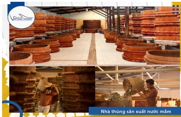
Nhà thùng sản xuất nước mắm