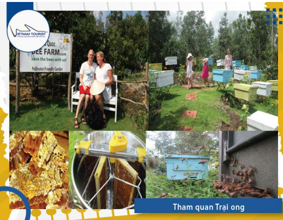
Tham quan Trại ong

16h00: Quý khách tiếp tục ghé thăm quan nhà tù Phú Quốc (hay còn gọi là nhà lao Cây Dừa) - nơi đây đã tái hiện lại chân thực nhất những minh chứng hào hùng của những chiến sĩ cộng sản trong cuộc đấu tranh giành độc lập dân tộc, du khách có thể cảm nhận và hình dung một cách chân thực nhất về những màn tra tấn man rợn tại nhà tù Phú Quốc – nơi được gọi là “địa ngục trần gian” trong thời kỳ chiến tranh, nơi khiến người xem cũng phải kinh ngạc và hãi hùng về sự tàn ác của chế độ thực dân và đế quốc.