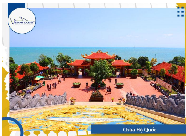
Chùa Hộ Quốc