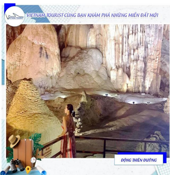
VIETNAM TOURIST CÙNG BẠN KHÁM PHÁ NHỮNG MIỀN ĐẤT MỚI ĐỘNG THIÊN ĐƯỜNG