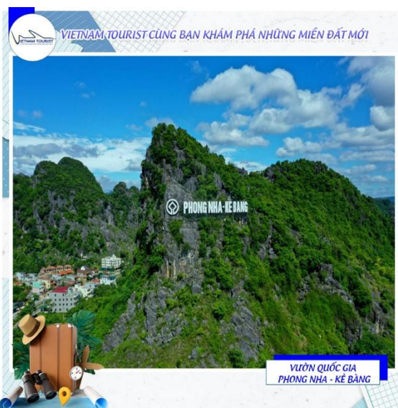
VIETNAM TOURIST CÙNG BẠN KHÁM PHÁ NHỮNG MIỀN ĐẤT MỚI VƯỜN QUỐC GIA PHONG NHA - KẼ BÀNG