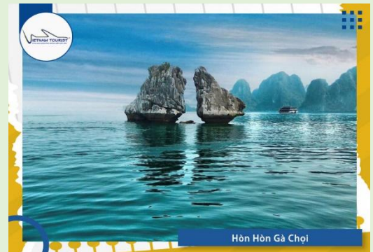
Hòn Gà Chọi