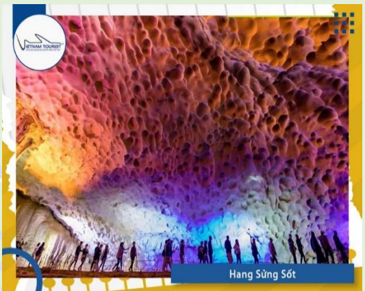
Hang Sừng Sốt