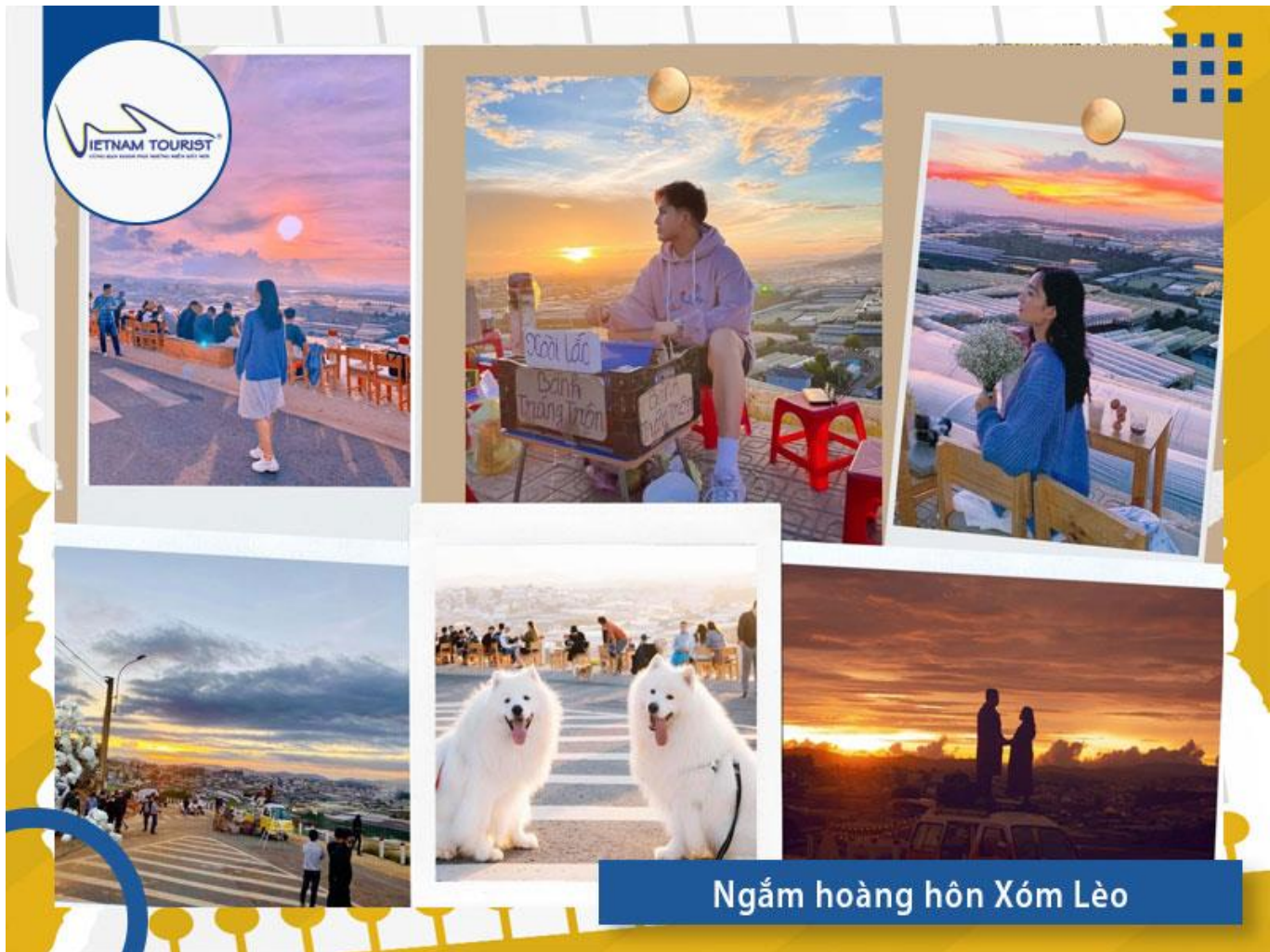
Ngắm hoàng hôn Xóm Lèo

18h00: Quý khách lên xe về lại khách sạn