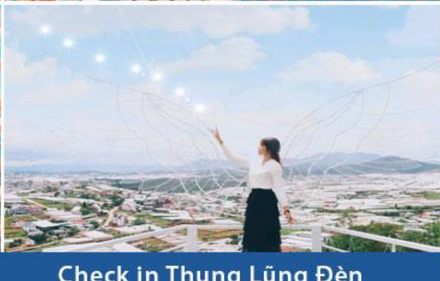
Check in Thung Lũng Đèn