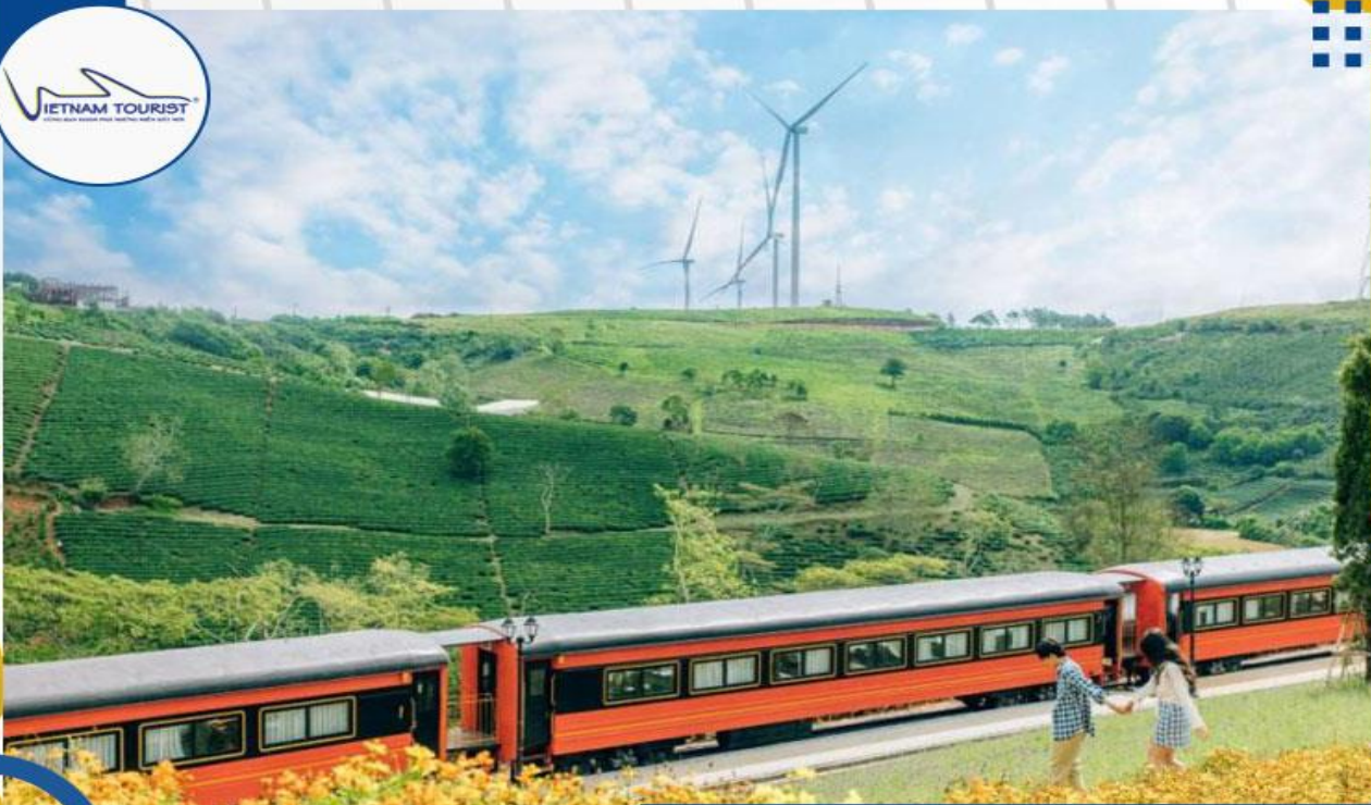
Đoàn tàu màu đỏ

07h30: Quý khách đi dùng điểm tâm 08h30: Quý khách check in Thung Lũng Đèn Đà Lạt - tọa lạc giữa một triền đồi có view thung lũng “ôm trọn” Đà Lạt mộng mơ. Tại đây, quý khách có thể ngắm trọn vẹn bức tranh thiên nhiên phố núi rực rỡ, hữu tình.