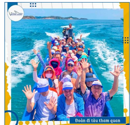
Đoàn đi tàu tham quan

13h30: Tàu rời cảng đưa quý khách bắt đầu hành trình khám phá Nam Du - Hạ Long của phương Nam.