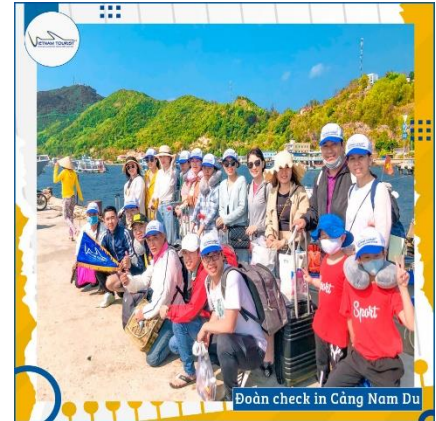
Đoàn check in Cảng Nam Du

08h50: Đoàn đến với Hòn Cũ Tron , hòn đảo lớn nhất thuộc Quần đảo Nam Du . Đoàn dùng điểm tâm sáng . Nếu nhà nghỉ có phòng sớm, đoàn sẽ được nhận phòng để nghỉ ngơi.